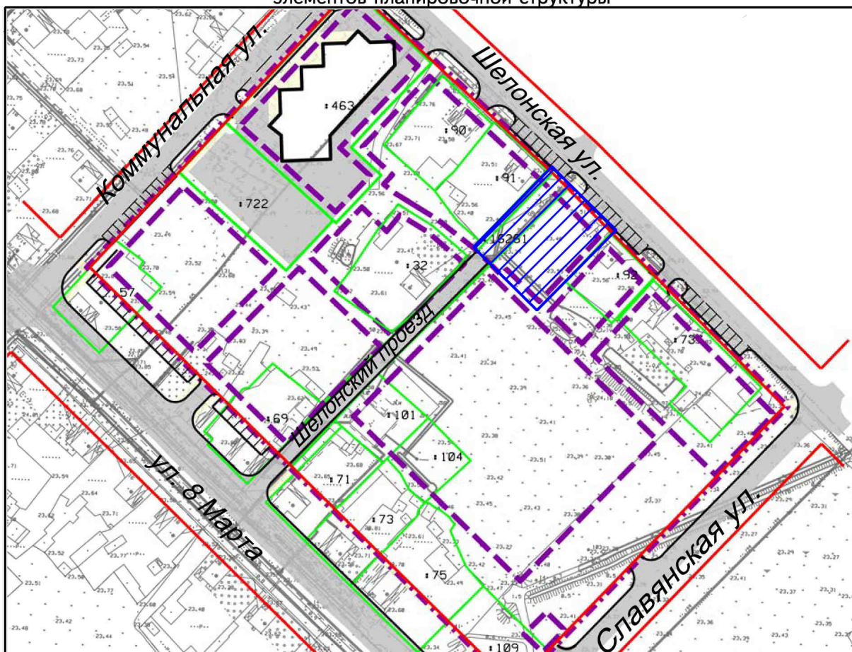
Внесение изменений в схему границ зон планируемого размещения объектов капитального строительства